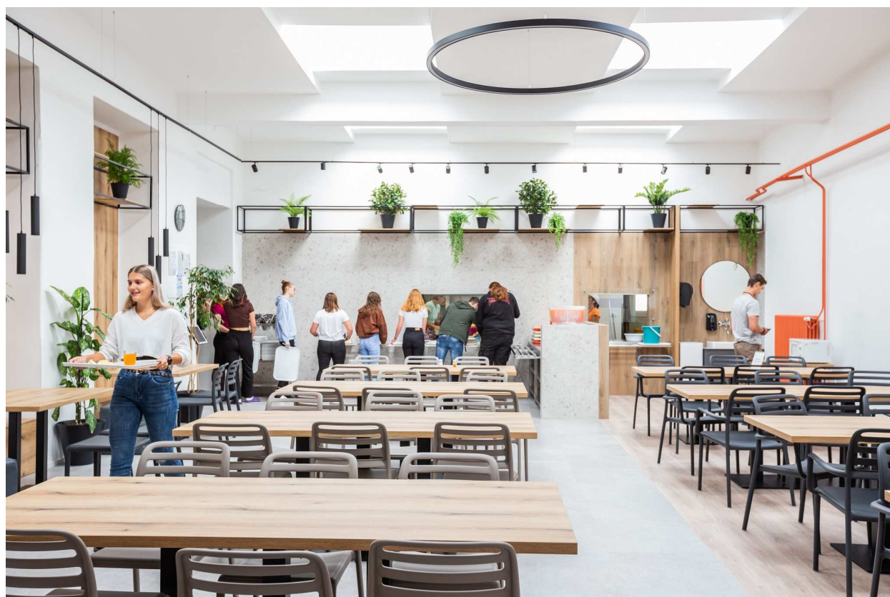
Školní jídelna po rekonstrukci