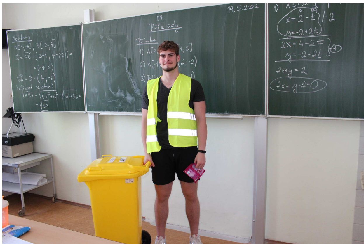
No Backpack Day – květen 2022