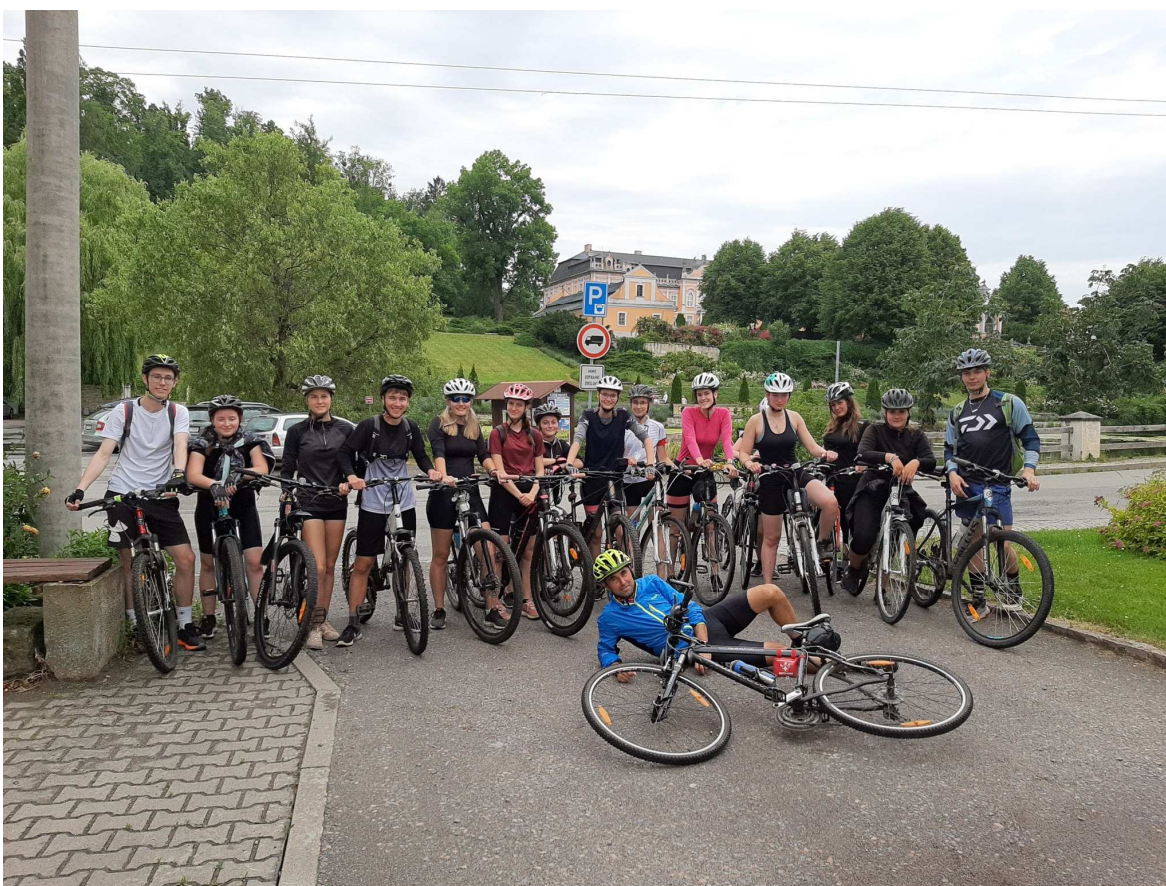
Sportovně turistický kurz – červen 2022