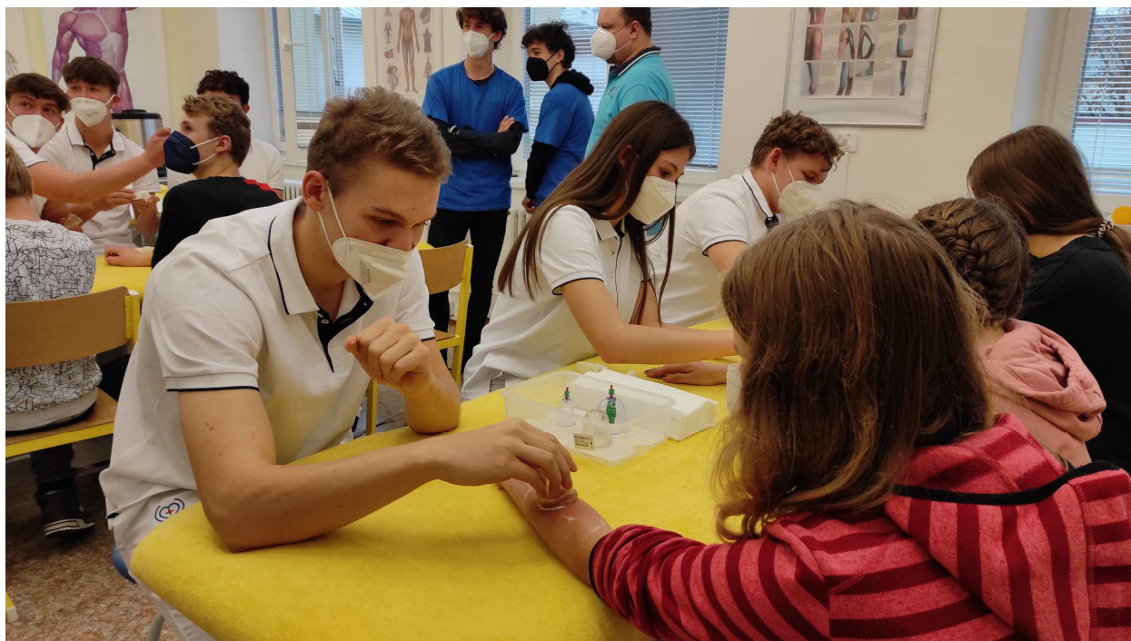
Zdravohrátky – listopad 2021