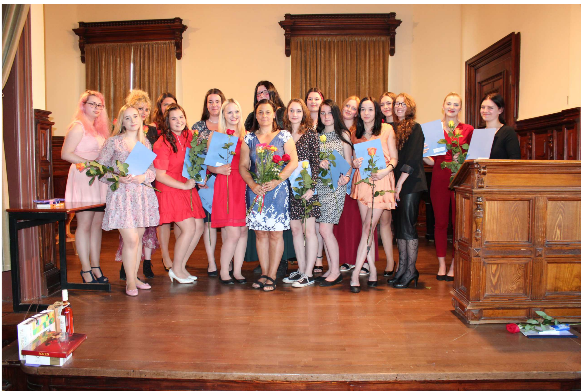
Předávání maturitního vysvědčení – červen 2022