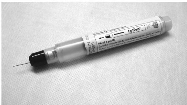
Obr. 13 – adrenalinové pero EPIPEN

Je vhodné, aby alergici byli vybaveni minimálně tabletami léku DITHIADEN . Ti, kteří již prodělali prudkou, život ohrožující alergickou reakci, mohou být vybaveni také adrenalinem v autoinjektoru s názvem EPIPEN nebo ANAPEN .