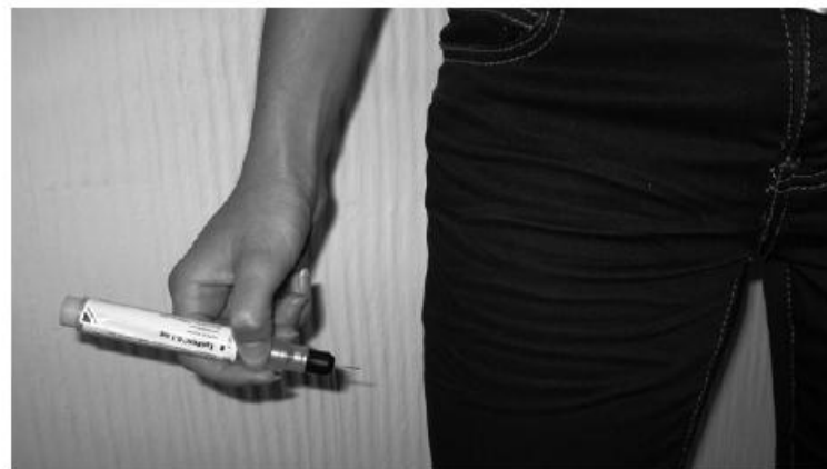
Obr. 14 – adrenalin v autoinjektoru lze aplikovat do stehenního svalu i přes kalhoty