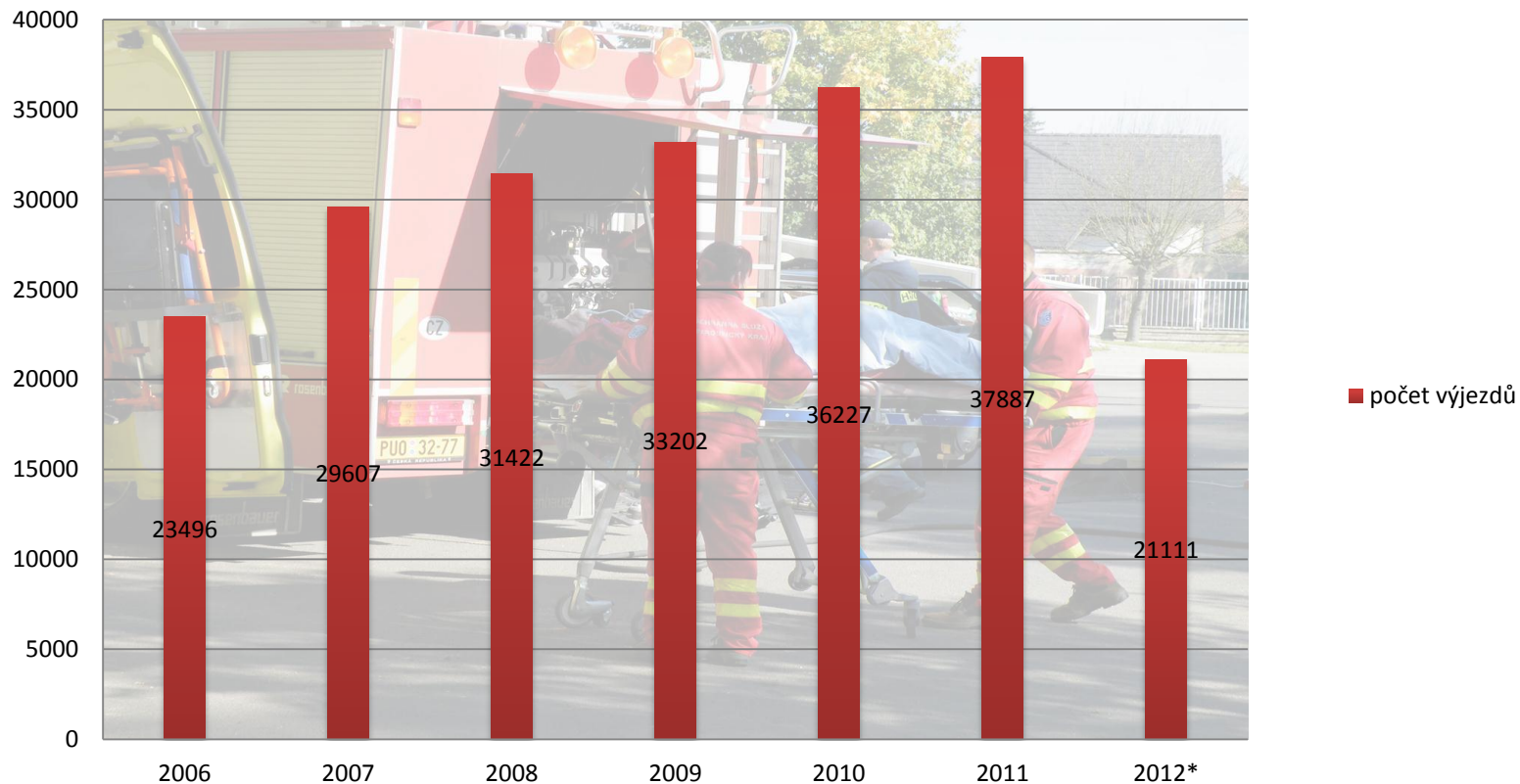
Počet výjezdů posádek ZZS PAK (* do 30.6.2012)